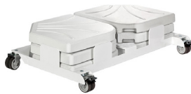
Base Cross con 4 piedras Cross base with 4 stones